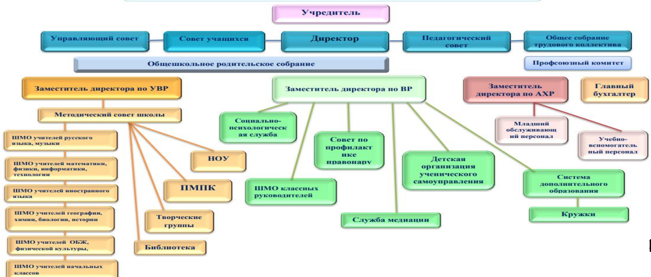
Структура и органы управления МОУ СОШ № 51