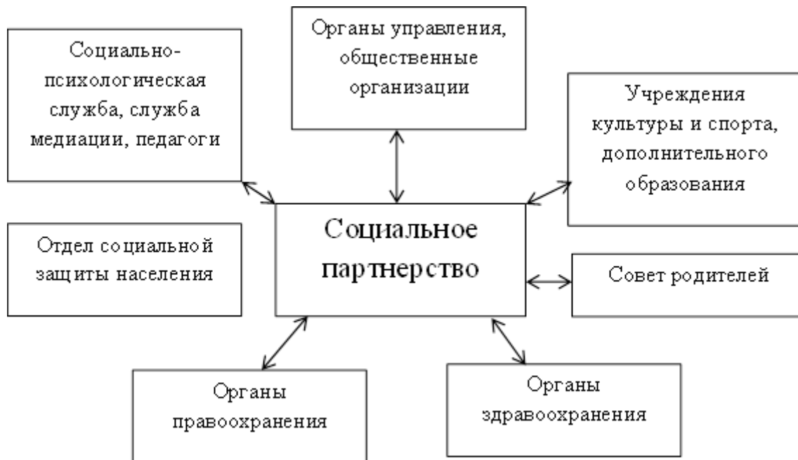
Рисунок 3 - Схема социального партнерства

Программа реализуется школой в постоянном взаимодействии и тесном сотрудничестве с семьями обучающихся, с другими субъектами социализации - социальными партнерами школы.