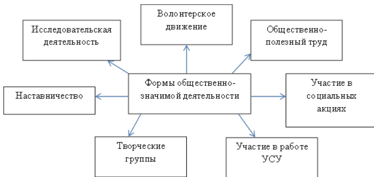
Рисунок 2- Схема форм общественно-значимой деятельности

свой жизненный путь. Поэтому наша школа будет и дальше развивать и совершенствовать данное направление.